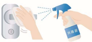
ホール入口の アルコール消毒設置

これら弊社の取り組みは、内閣府、経済産業省等各省庁の協力によって 全日本葬祭業協同組合連合会等業界団体がとりまとめた葬儀業「新型コロナウイルス感染拡大防止ガイドライン」に沿った対策となります。