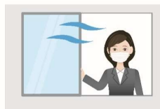
定期的な換気の実施