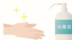
手洗い・消毒等 の徹底