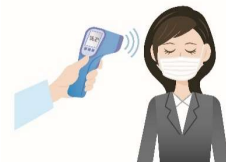
スタッフの検温等、 体調管理の徹底