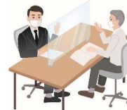
打合せの際にお客様 との間を隔てる パーティションを 設置