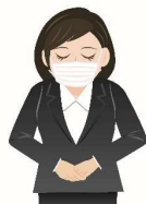
スタッフのマスク 着用の徹底