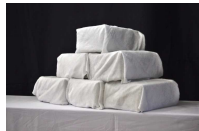
ドライアイス 15キロ