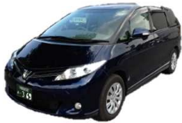
寝台車10km×2回まで @15,000円(10kmまで)

※菩提寺・墓所をお持ちの方で火葬のみをお考えの方は事前にご住職にご相談の上 火葬プランをお選び下さい。